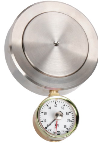
Гидравлический преобразователь силы сжатия, модель F1135

Работа гидравлических преобразователей силы основана на принципе преобразования силы, действующей на поршень, в гидравлическое давление, пропорциональное площади поршня. Оценка измеренной величины производится с помощью аналогового или цифрового измерительного прибора.